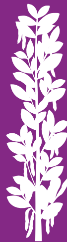
Haricots et vesces