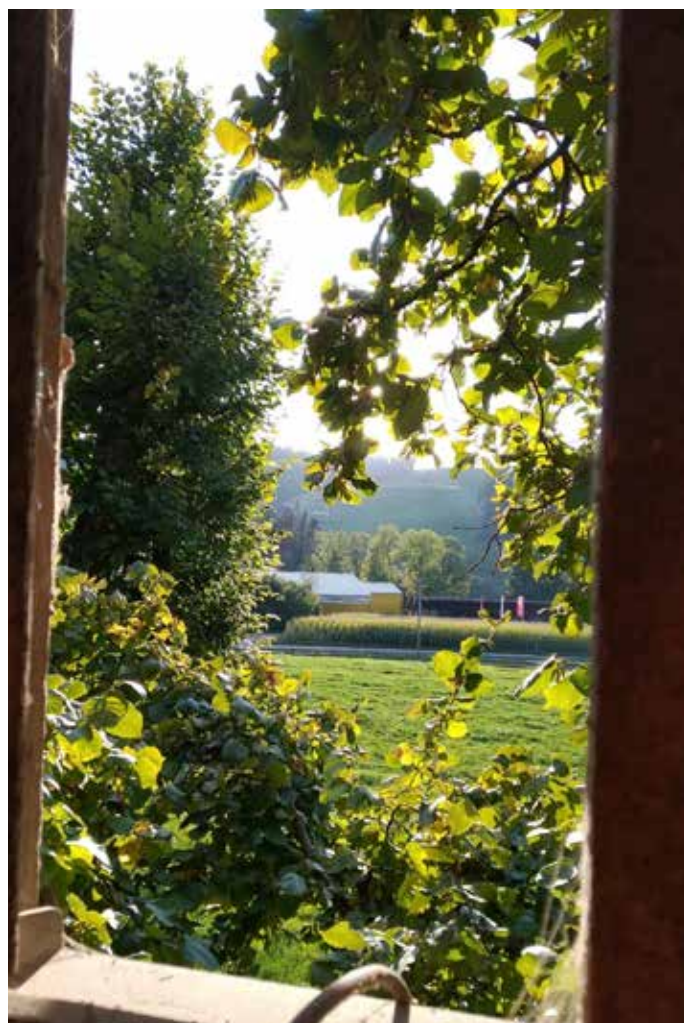
Concours photo 2019: Camila Saldariaga (chez Fam. Nyffenegger)