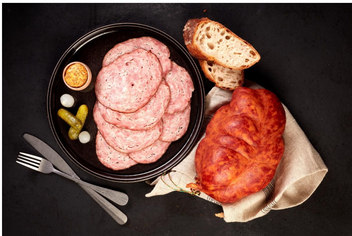
Image : Boutefas