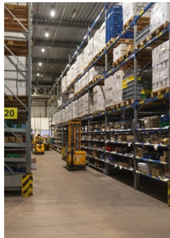
Plateforme de Genève. Plattform Genf.

Der Abschluss neuer Logistikverträge und die Stärkung der Partnerschaft mit der Firma Galliker tragen erheblich zu diesem Erfolg bei.