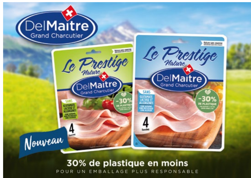
Des emballages plus responsables! Verantwortungsvollere Verpackungen!

En 2023 le cap sera mis sur l'efficacité énergétique et le développement de nouveaux marchés alors que Maître Boucher s'appuiera sur ses points forts traditionnels, notamment un rapport qualité / prix / service incomparable.