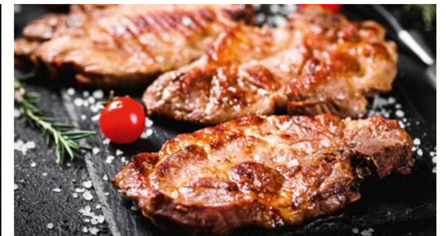
Côtelettes de porc aux herbes et à la tomate Schweinskoteletts mit Kräutern und mit Tomate.