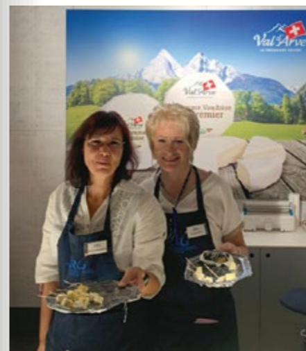
Foire du Valais et des Automnales de Genève. Foire du Valais und Automnales in Genf.