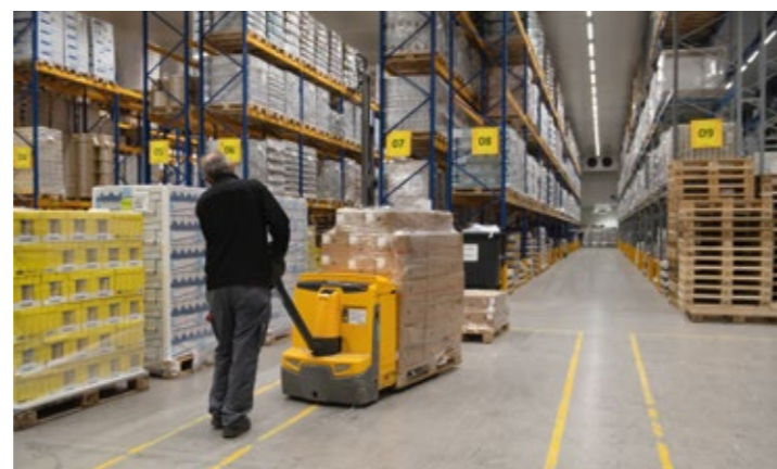
Plateforme de Bannwil (BE).

Pour faire face au fort développement des activités, le Conseil d'administration a validé le projet d'agrandissement de la plateforme de Bannwil. Le site de Plan-les-Ouates connaît aussi un regain d'activité avec la progression des ventes de lait conditionné et l'augmentation des volumes de fromages commercialisés.