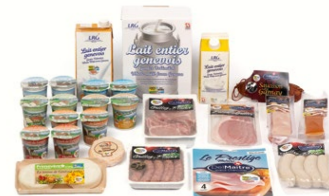
Notre gamme GRTA LRG. Unser GRTA-Sortiment LRG.

Die Ungewissheit über die weitere Entwicklung des Ukrainekrieges und die Inflationsaussichten werden die Wirtschaft in den nächsten Monaten noch stark belasten. Angesichts dieser Herausforderungen werden 2023 neue Massnahmen zur Rationalisierung der Produktion an unseren beiden Standorten in Genf ergriffen werden. Der vom Verwaltungsrat bestätigte Strategieplan auf der Basis der Innovation, der Qualität, der Handelsdynamik, der Kommunikation und der Optimierung industrieller Prozesse wird auch 2023 die Position der Laiteries Réunies Gruppe auf dem Schweizer Markt und im Export stärken.