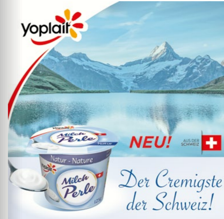
Perle de Lait devient Milch Perle pour la Suisse alémanique. Nouvelle campagne de promotion pour notre produit « le plus crémeux de Suisse ».