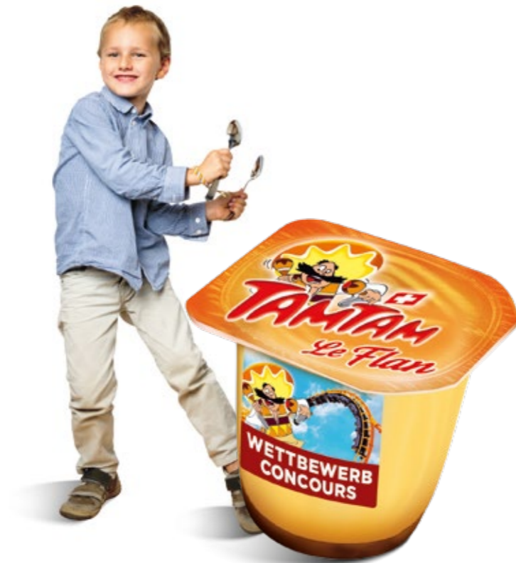
Nouveau TamTam Coop Naturaplan. Neues Coop Naturaplan TamTam.

L'année aura aussi été marquée par un développement important des ventes de Perle de Lait, désormais proposé chez Migros Genève sous 5 références et en Suisse alémanique chez Coop sous la nouvelle marque « Milch Perle ».